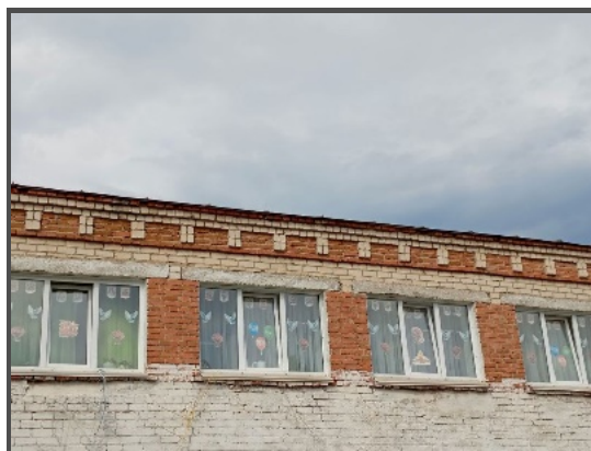
Акция «Окна Победы»