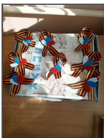
Акция «Георгиевская ленточка» совместно с Домом Творчества