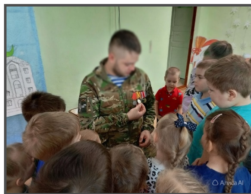
Встреча с участником СВО