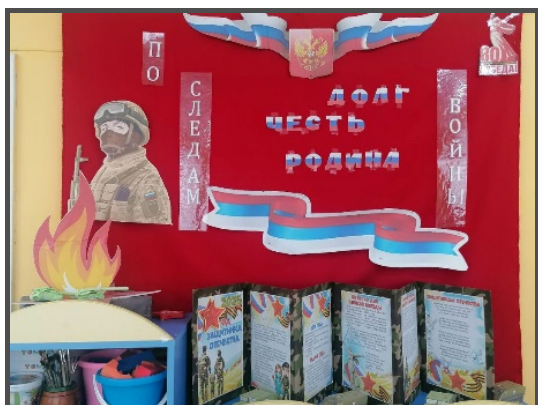
Патриотический уголок в старшей группе