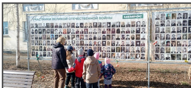
Экскурсия на Аллею Славы