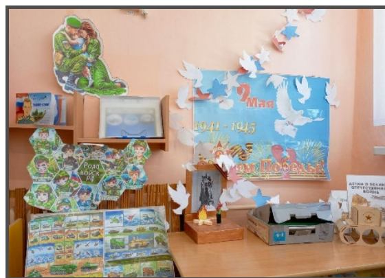
Патриотический уголок в младшей группе