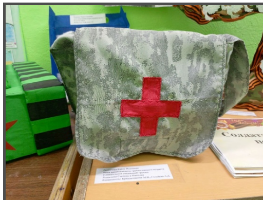
Поделки к 9 мая

В 2025 году в детском саду был проведён цикл мероприятий, посвящённых Году Защитника Отечества.