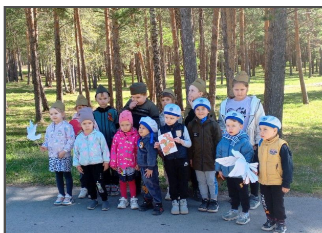
Акция «Подари голубя» (экскурсия по поселку)