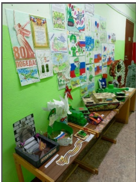
Выставка к 80-летию Победы