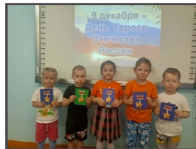
Совместное творчество родителей и детей