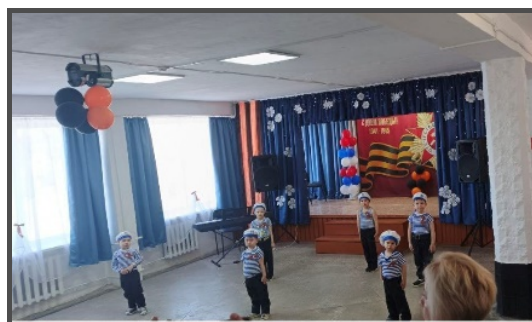
Участие в празднике ко Дню Победы